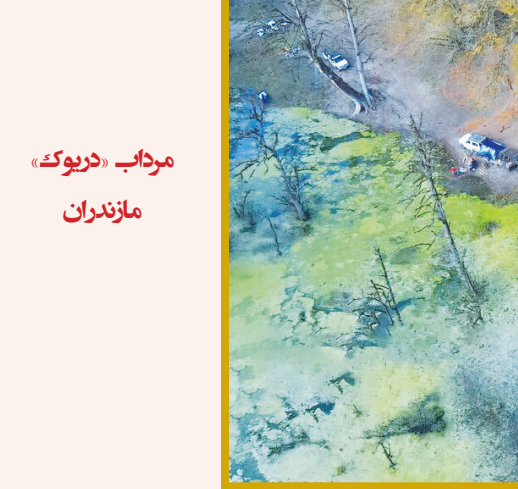
مرداب «دیوک»، ملازندان

یافته‌های غار «هستیجان»، که با غارت گسترده مواجه شده است، به بررسی باستان‌شناسان گذاشته می‌شود. به این بهانه یک پوست‌نوشت از مجموعه‌ای که به خارج از ایران منتقل‌شده نیز منتشر شده است. نامه‌ای از یک برادر (احتمالاً) ساسانی به خواهرش. به گزارش ایسنا، «هستیجان»، غاری در دلجان از توابع استان مرکزی است که کاوش‌های باستان‌شناسان تاریخ این غار را به اواخر دوره ساسانی نسبت داده است. باستان‌شناسان تا سه چهار ماه پیش از وجود چنین غاری اطلاعی نداشتند. مصطفی ده‌پهلوان - رئیس پژوهشگاه میراث فرهنگی، گردشگری و صنایع‌دستی - گفته است: نه در نقشه باستان‌شناسی و نه در گزارش‌های باستان‌شناسی به نام این غار اشاره‌ای نشده بود، تا اینکه یکی از کارشناسان زبان پهلوی در خارج از کشور متوجه چرم‌نوشته‌هایی شد که اطلاعات‌ذی‌قیمتی را در اختیار می‌گذاشت. او در ادامه با پیگیری متوجه شد بسیاری از این آثار از کشور خارج شده است و با پرس‌وجو متوجه شد خاستگاه این چرم‌نوشته‌ها غاری در استان مرکزی است. بنابراین کاوش اضطراری در غار هستیجان آغاز شد.