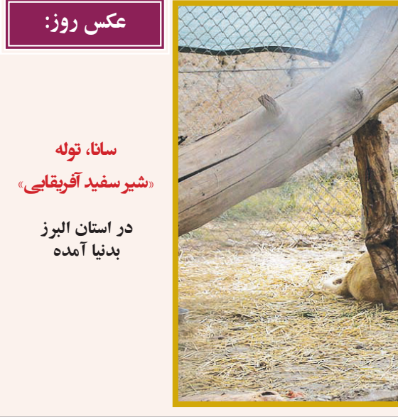
عکس روز: سانا، توله «شیر سفید آفریقایی» در استان البرز بدینا آمده

تاد فیلیس کارگردان فیلم جدید «جوکر: جنون دو نفر» تصاویر جدیدی از واکنش فینیکس و لیدی گاگا بازیگران اصلی این فیلم منتشر کرد. به گزارش ایلنا به نقل از دلاین، بدون شک دنباله فیلم سینمایی موفق «جوکر»، یکی از مورد انتظارترین فیلم‌هایی است که قرار است در سال جدید میلادی راهی سینماها شود و تاد فیلیس کارگردان این فیلم نیز به مناسبت ایام کریسمس تصاویر جدیدی از این فیلم سینمایی را منتشر کرد. در فیلم اصلی «جوکر» در سال ۲۰۱۸ «تاد فیلیس» شخصیت شرور نمادین بنمن را در قالب یک شخصیت ضدقهرمان درباره یک کم‌دین مبارز و دل‌تک پاره وقت به نام «آرتور فلک» که پس از شش‌هفت تکان دهنده در شهر گاتهام تبدیل به یک قهرمان مردمی می‌شود، روایت کرد. این فیلم تاریک با ضرب آهنگی متفاوت با فیلم‌های اکشن معمولی و سینمای ابرقهرمانی، به یک فیلم پرفروش در گیشه جهانی تبدیل شد و در سال ۲۰۱۹ به فروشی بیش از یک میلیارد دلار در سرتاسر جهان دست یافت، درحالی‌که بودجه ساخت آن تنها ۷۰ میلیون دلار بود. «جوکر» همچنین در ۱۲ شاخه جوایز آکادمی اسکار از جمله بهترین فیلم، کارگردانی، فیلمنامه اقتباسی نامزد اسکار شد و در نهایت جایزه اسکار بهترین بازیگر مرد (واکین فینیکس) و بهترین