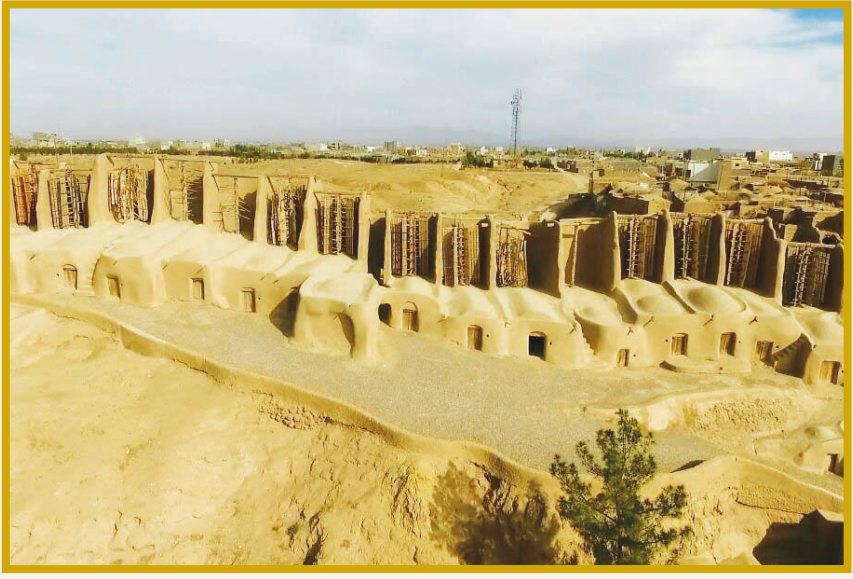
آسی‌یادهای سنگان خواف در فهرست آثار ملی ثبت شد