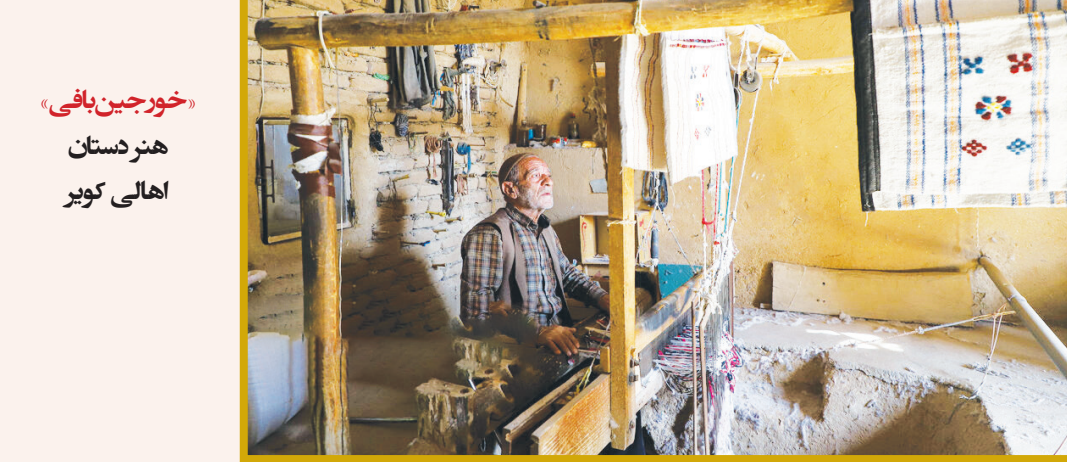
عکس روز: خورجین‌بافی هنر دستن اهالی کویر

«اسطوره» با بهره‌گیری از تکنیک کمیک موشن و بصورت ۲D در استودیو پویانو مشهد و در رویداد هنر حماسی حوزه هنری خراسان رضوی، توسط تیمی جوان به تولید رسیده و همزمان با فرارسیدن