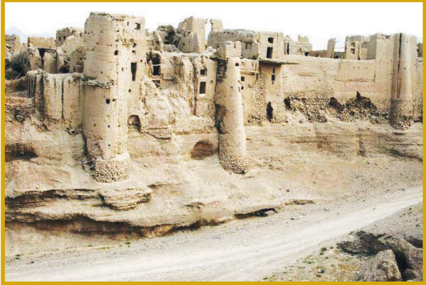
قلعه باستانی ایزدخواست