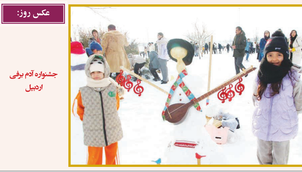
عکس روز: جشنواره آدم برفی اردبیل

بنای «درب ۱۷۱۸»، مرکز هنرهای معاصر نمادین قاهره که در جوار بناها و محوطه‌های تاریخی و باستان‌شناسی فراوانی قرار دارد به دستور دولت مصر تخریب شد. به گزارش ایسنا، مسئولان این مرکز هنری در شبکه‌های اجتماعی نوشتند: «عمیقاً متأسف و خشمگین هستیم که تخریب بدون اطلاع قبلی ساختمان اصلی درب ۱۷۱۸، یک بنای تاریخی قاهره را که به عنوان پناهگاهی برای هنرمندان و صنعتگران از همه نوع بوده است، اعلام می‌کنیم. تخریب این بنا یادآور تهدیدات مداوم میراث و بافت تاریخی قاهره است.» به گفته مقامات این مرکز، این ساختمان برای تعریض یک بزرگراه تخریب شده است. قاهره در حال توسعه گسترده‌ای است؛ زیرا عبدالفتاح السیسی، رئیس‌جمهور مصر تلاش می‌کند تا این شهر جمعیت را مدرن کند و پایتخت جدید ۵۹ میلیارد دلاری خود را در حاشیه صحرا بسازد. دولت مصر تاکنون بیش از ۴ هزار مایل جاده جدید و ۹۰۰ تونل و پل را به عنوان بخشی از این پروژه ساخته، اما این طرح توسعه منجر به تخریب کل محله‌ها و نقاط دیدنی شده است. ساختمان «درب ۱۷۱۸» واقع در منطقه الفسطاط در بخش قدیمی قاهره قرار دارد که توسط گنجینه‌های باستان‌شناسی و تاریخی احاطه سال رخ داد.