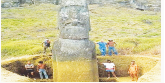
بر اساس تحقیقاتی که توسط دانشگاه «بینگهتون» در نیویورک انجام شده، نحوه قرارگیری مجسمه های «موآی» کاملاً عامدانه