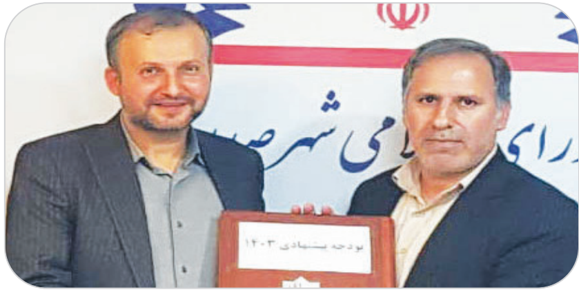
شهردار صدرا خبر داد: