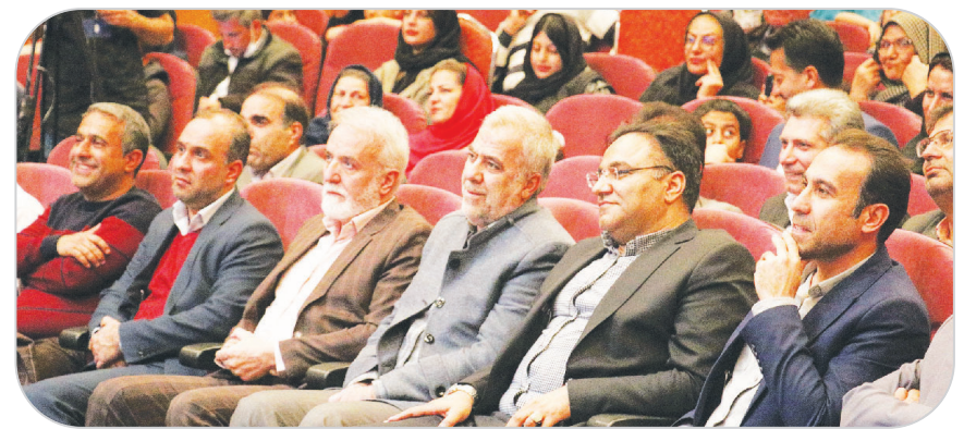
در راستای تشویق شهروندان در پرداخت عوارض برگزار شد: