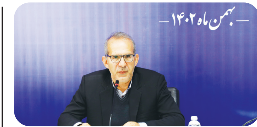
رئیس دانشگاه علوم پزشکی شیراز: