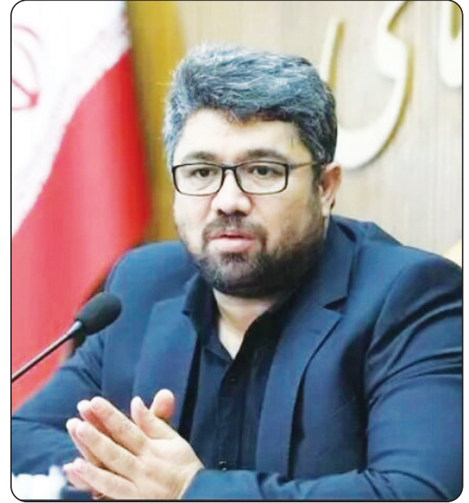
شهردار منطقه ۹ شیراز خبر داد: