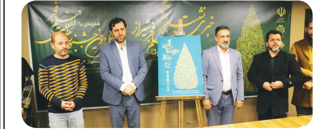
مدیر کل فرهنگ و ارشاد اسلامی استان فارس خبر داد:

تحلیل این خبر را در ستون «تحلیل خبر» بخوانید