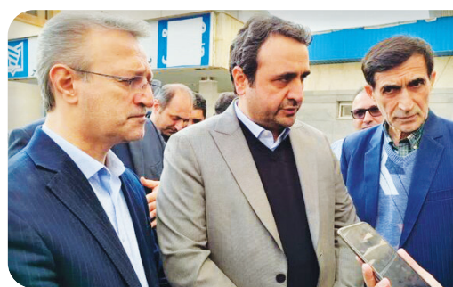
مدیرعامل سازمان تأمین اجتماعی گفت: