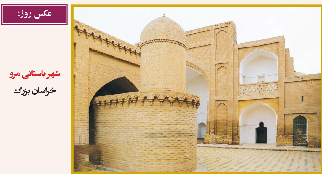
عکس روز: شهر باستانی مرو خراسان بزرگ

مقامات وزارت آثار باستانی مصر تصمیم خود را برای مرمت هرم باستانی «مَنْقَرَع» پس از بررسی و اعتراض بین‌المللی، کنار گذاشتند. به گزارش ایپا، این پروژه، بازسازی پوشش بیرونی گرانیتی در چهار طرف هرم «مَنْقَرَع» را در مشارکتی بین دولت مصر و باستان‌شناسان ژاپنی دنبال می‌کند که بر اساس آن، نمای این هرم با بلوک‌های اصلی پراکنده در اطراف پایه هرم، مرمت می‌شد، که با اعتراض گسترده به‌ویژه از سوی باستان‌شناسان مصر مواجه شد. اکنون کمیته‌ای که توسط وزیر گردشگری مصر تشکیل شده است، در بیانیه‌ای اعلام کرد این کشور طرح بحث‌برانگیز برای نصب دوباره پوشش گرانیتی باستانی روی هرم «مَنْقَرَع»، کوچک‌ترین اهرام سه‌گانه بزرگ جیزه را لغو کرده است. مصطفی وزیری، دبیر کل شورای عالی آثار باستانی، ماه گذشته این طرح را اعلام و آن را «پروژه قرن» توصیف کرده بود. خبرهایی مبنی بر اینکه این بنای باستانی می‌تواند به سرعت تغییر کند، اعتراض بین‌المللی را برانگیخت و مقامات باستانی مصر را بر آن داشت تا این پروژه را بررسی کنند. اهرام مصر تنها عجایب هفتگانه جهان باستان هستند که هنوز باقی مانده‌اند. «مَنْقَرَع» به تنهایی در میان اهرام به گونه‌ای طراحی شده بود، که به جای سنگ آهک از گرانیت پوشانده شود. تنها ۱۶ تا ۱۸ لایه گرانیت قبل از توقف ساخت‌وساز نصب شد که ظاهراً به دلیل مرگ مَنْقَرَع در حدود ۲۵۰۳ پیش از میلاد متوقف شده بود. در طول قرن‌ها، دزدی، فرسایش و فروریختن باعث ناپدید شدن بسیاری از لایه‌های این هرم شد و در دوران مدرن تنها هفت لایه باقی ماند؛ اگرچه تعداد زیادی بلوک گرانیتی افتاده در اطراف پایه هرم پراکنده شده بودند. پروژه جایگزینی گرانیت‌ها قرار بود پس از یک سال اسکن و مستندسازی اجرایی شود.