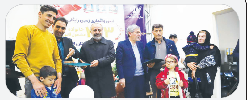
مدیر کل راه و شهرسازی فارس خبر داد:

تحلیل این خبر را در ستون «تحلیل خبر» بخوانید