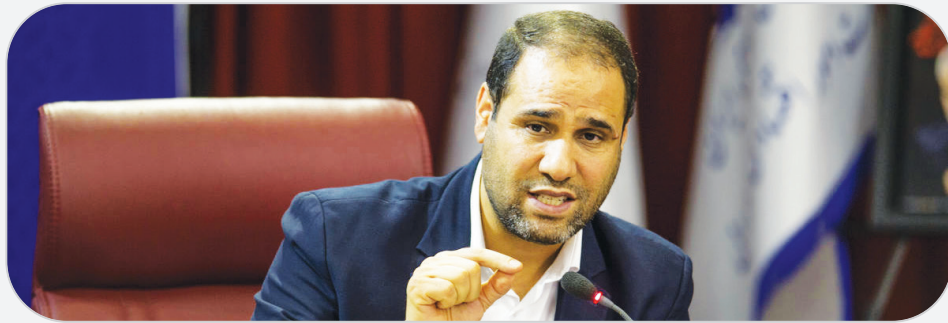
وزیر آموزش و پرورش:

اما اگر با اغراض و مقاصد سیاسی، نهاد آموزش و پرورش بازیچه سیاسیون قرار گیرد و متر و شاقول سیاسی خود را وارد محیط آموزشی و ذهن دانش‌آموزان کنند، نتیجه معکوس خواهد داد و باعث چند دستگی و اختلال بین دانش‌آموزان خواهد شد. ماهیت آموزش و تربیت، ماهیت یکسان و یگانه‌ای است و باعث وحدت در نظام آموزشی و بین دانش‌آموزان شده و آنها را در مسیر واحدی هدایت می‌کند اما ماهیت مسائل سیاسی، ماهیت چند گونه و متضادی است که باعث تفرقه و اختلاف بین آنان می‌شود. پس باید کار سیاسیون را به خودشان و کار تربیت را به معلمان و مربیان و اولیای دانش‌آموزان واگذار کرد و با عدم تداخل «کارکردی» بین این دو، نظام تعلیم و تربیت را از آسیب‌ها و ضربات بیرونی حفظ کرد.