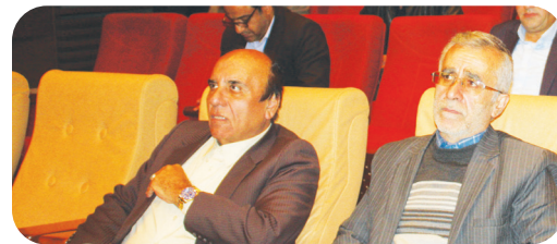
رئیس اتاق اصناف مرکز استان فارس: