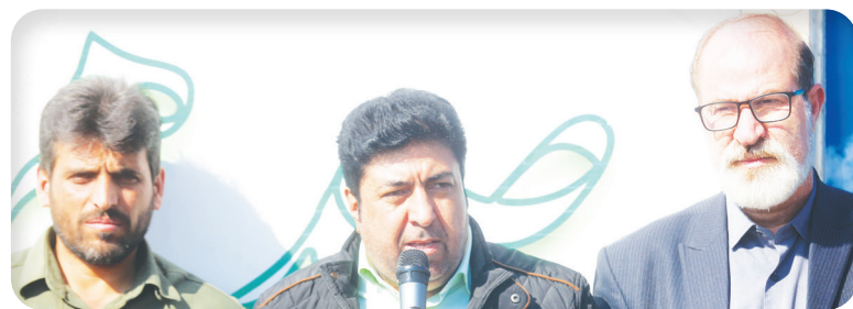
رئیس سازمان سیما منظر و فضای سبز شهری شهرداری شیراز خبر داد: