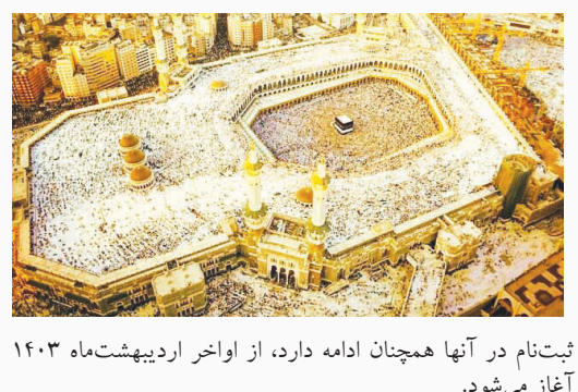
ثبت‌نام در آنها همچنان ادامه دارد، از اواخر اردیبهشت‌ماه ۱۴۰۳ آغاز می‌شود.