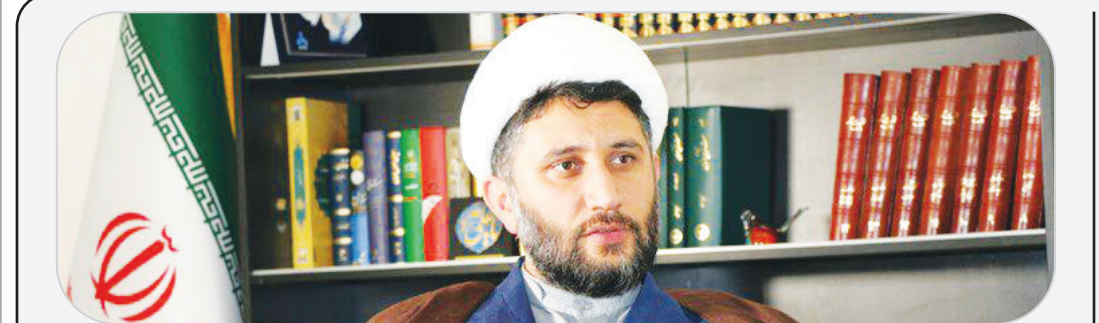
صفری عضو کمیسیون امور داخلی کشور:

مدت زمان حمایت، پرداخت مستمری و انجام فرایند توانمندسازی بانوان سرپرست خانوار ۳ سال است