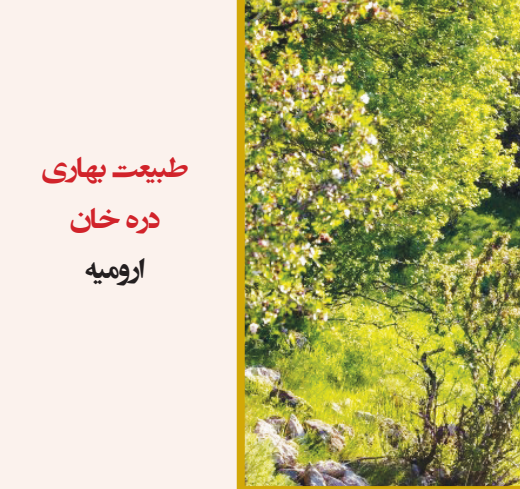
طبیعت بهاری دره خان ارومیه