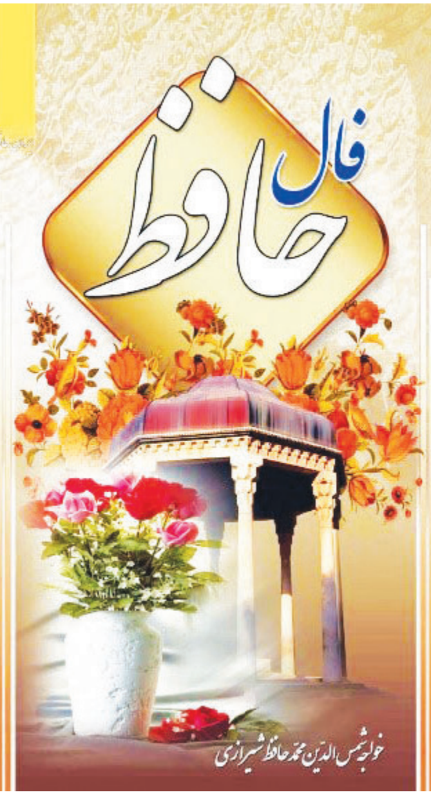
خواجه شمس الدین محمد حافظ شیرازی