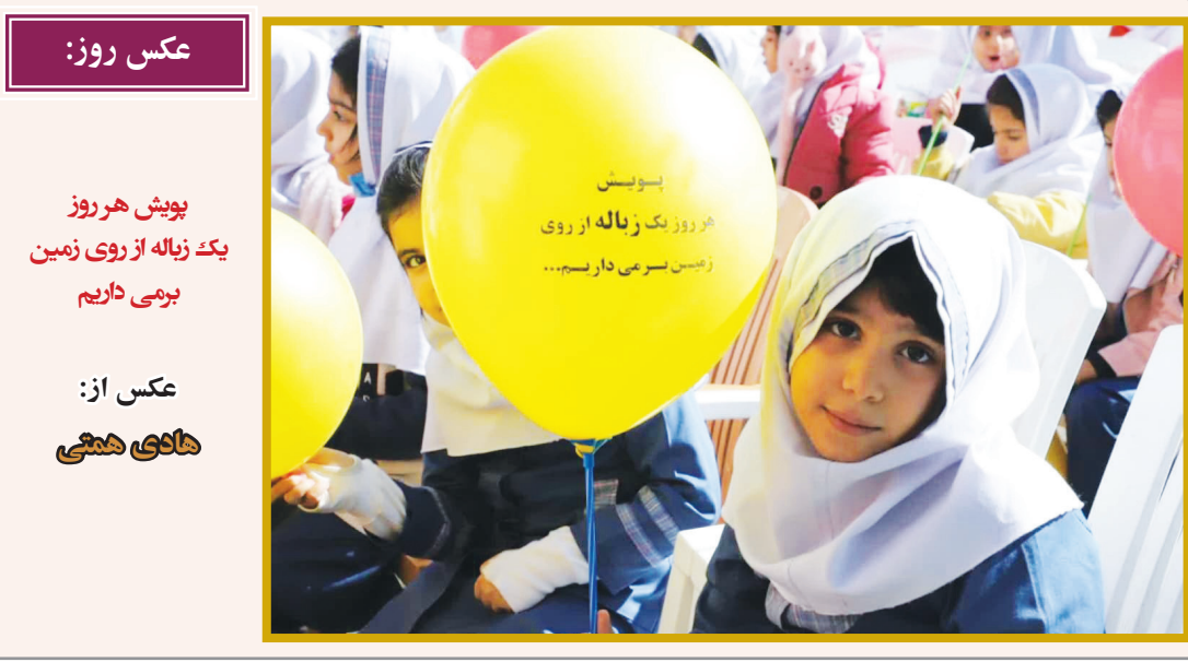
عکس روز: پویش هر روز یک زنانه از روی زمین سبزی داریم...

جریان فکری و نگرش غالب در فرآیند طراحی معماری و جمع‌بندی کتاب «یک سده معماری، ده عمارت تهران»، رونمایی می‌شود. این اثر منتخبی از معرفی بناهای عمومی صدساله اخیر کلان شهر تهران است. به گزارش ایلتنا، این کتاب به معرفی و تحلیل ۱۰ اثر منتخب از بناهای عمومی صدساله اخیر کلان شهر تهران، به منظور درک بهتر