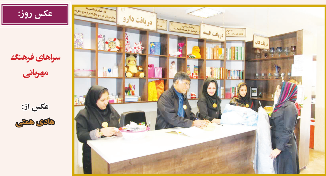
عکس روز: