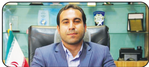
معاون شهردار شیراز خبر داد؛

تحلیل این خبر را در ستون «تحلیل خبر» بخوانید