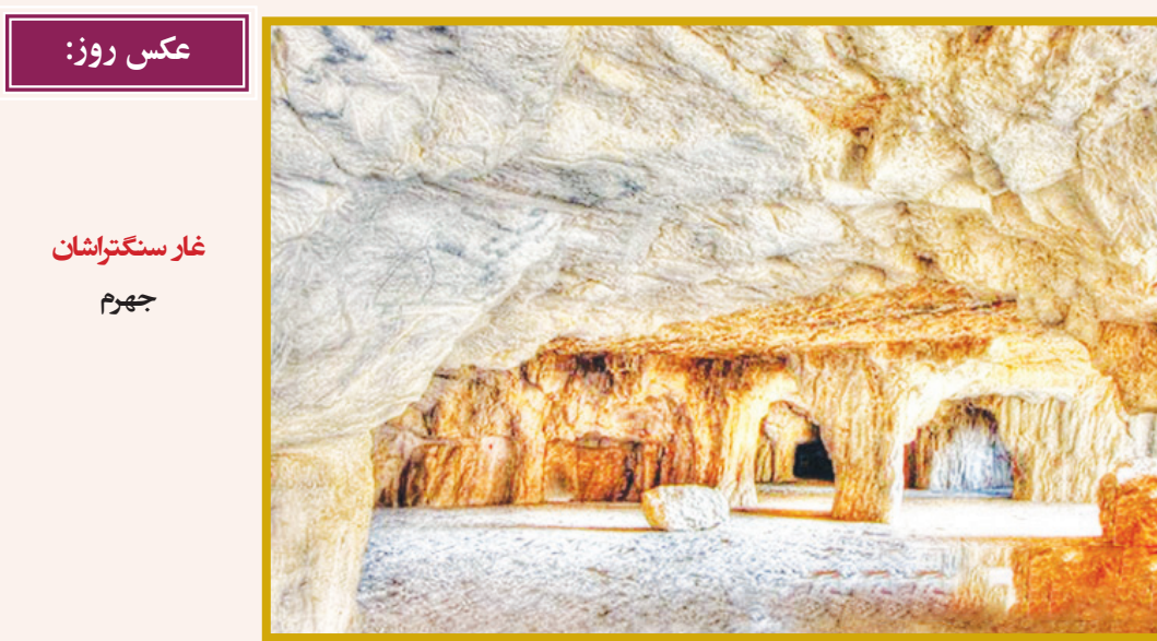
عکس روز: غار سنگتراشان جهرم

اکران مجدد «آملی پولن» برای گردشگران المپیک فیلم کلاسیک «آملی پولن» محصول سال ۲۰۲۱، همزمان با رقابت‌های المپیک پاریس برای گردشگران در فرانسه اکران می‌شود. به گزارش ایسنا، فیلم کلاسیک و رومانیتیک «سرنوشت شگفت‌انگیز آملی پولن» محصول سال ۲۰۰۱ به کارگردانی ژان پیر ژونه، مسلماً بیش از هر فیلمی دیگری در تبلیغ گردشگری پاریس نقش داشته است، داستان عجیب یک دختر نیکوکار خجالتی پاریسی با بازی آدری توتو در نقش اصلی که مصمم به شاد کردن شهروندان فرانسه بود. این فیلم با بازی متیو کاسوویتز، جمل دپوز، ایزابل نانتی و دومینیک پینون با دریافت ۱۳ نامزدی و چهار جایزه از جمله بهترین فیلم و بهترین کارگردانی در جوایز سزار فرانسه، و پنج نامزدی اسکار از جمله برای بهترین فیلم بین المللی عملکرد موفق داشت و در گیشه نیز حدود ۹ میلیون بلیط در فرانسه و بیش از ۳۰ میلیون در سراسر جهان فروخت و به با بودجه ۱۰ میلیون دلاری به فروش جهانی چشمگیر ۱۷۵ میلیون دلاری دست یافت. اکنون، گردشگرانی که برای بازی‌های المپیک تابستانی ۲۰۲۴ به این پاریس می‌روند، فرصتی برای بازدید مجدد از آملی در پاریس خواهند داشت. کمپانی «UGC» این فیلم را در سینماهای فرانسه در نسخه اصلی آن با زیرنویس انگلیسی دوباره اکران می‌کند، به