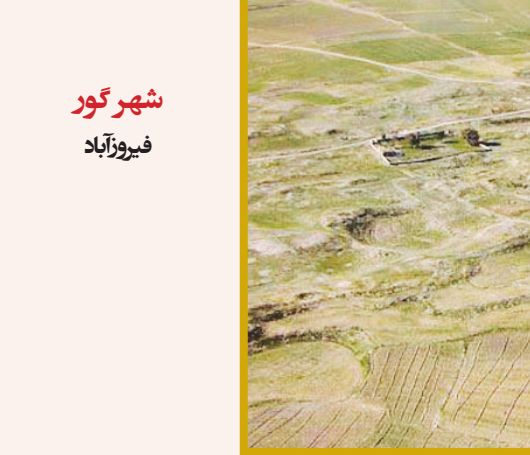
شهر گور فیروزآباد

این استاد دانشگاه با تأکید بر اینکه مردم و مسئولین باید زمینه معرفی سایر جاذبه‌های گردشگری اورامانات را فراهم کنند، افزود: این مسئله باعث می‌شود که گردشگران تنها در این نقطه تمرکز پیدا نکنند، بلکه در کل اورامانات پخش شوند و دیگر نه ترفیقای‌های چند کیلومتری تشکیل شود و نه در بحث زیرساخت‌های اقامتی و پذیرایی کمبودهایی به وجود می‌آید. به گفته این استاد دانشگاه عدم توزیع مناسب گردشگر در منطقه اورامانات باعث شده تا تأثیر گردشگری روی سفر همه مردم این منطقه به شکل یکسانی نباشد. وی در ادامه یکی دیگر از مشکلات موجود در منطقه اورامانات را عدم نظارت کافی بر ارائه خدمات اقامتی و پذیرایی به گردشگران دانست و گفت: متأسفانه گاه‌ها مشاهده می‌شود که در ایام پیک سفر یک خانه مسافر با حداقل امکانات هزینه‌های گزافی را از مسافران و گردشگران می‌گیرد که این موضوع می‌تواند تصویری منفی را از این منطقه در ذهن گردشگران بوجود آورده و آنها را از سفر بعدی به این منطقه منصرف کند که در این زمینه ضروری است که مسئولین امر برخورداری جدی را با متخلفین داشته باشند.