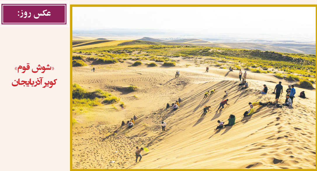
عکس روز: «شوش قوم» کویر آذربایجان

سریال جنایی «اسکناس جعلی» محصول کشور هند برای پخش از شبکه تهران دوبله شد. به گزارش مهر به نقل از پایگاه اطلاع‌رسانی سیمایا، این سریال در گونه جنایی، درام و هیجانی محصول هند در سال ۲۰۲۳ قرار است از شبکه تهران پخش شود. این سریال درباره سانی نقاش فقیر اما ماهری است که به ناچار به خاطر مشکلات مالی به نقاشی پول تقلبی روی می‌آورد و همین او را