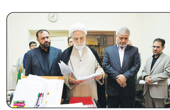
پرونده «ریگان‌خودرو» با بیش از هزار شاکی است که بنا به گفته رئیس شعبه، با اقدامات و تدابیر و ابتکارات دستگاه قضایی، تا پایان شهریور، کل طلب شکات این پرونده پرداخت خواهد شد.

رئیس قوه قضاییه در بازدید از مجتمع قضایی تخصصی ویژه رسیدگی به جرائم اقتصادی تهران در جلسات دادرسی و رسیدگی به چند پرونده مهم از جمله «رمزارز کینگمانی»، «کریپتولند»، «ریگان خودرو»، «شرکت فولاد مبارکه سپاهان» و «چای دیش» شرکت کرد. به گزارش ایرنا از مرکز رسانه قوه قضاییه، حجت‌الاسلام والمسلمین غلامحسین محسنی‌اژه‌ای در ادامه سرکشی‌ها و بازدیدهای میدانی و آسیب‌شناسانه و مسئله‌محور خود از مراجع و مراکز قضایی، حدود ۴ ساعت از مجتمع قضایی تخصصی ویژه رسیدگی به جرائم اقتصادی تهران بازدید کرد و از نزدیک در جریان کم‌وکیف رسیدگی به پرونده‌ها در این واحد قضایی قرار گرفت.