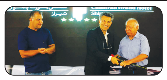
به پاس تجلیل از تلاشگران عرصه‌های مختلف رقم خورد:

تحلیل این خبر را در ستون «تحلیل خبر» بخوانید