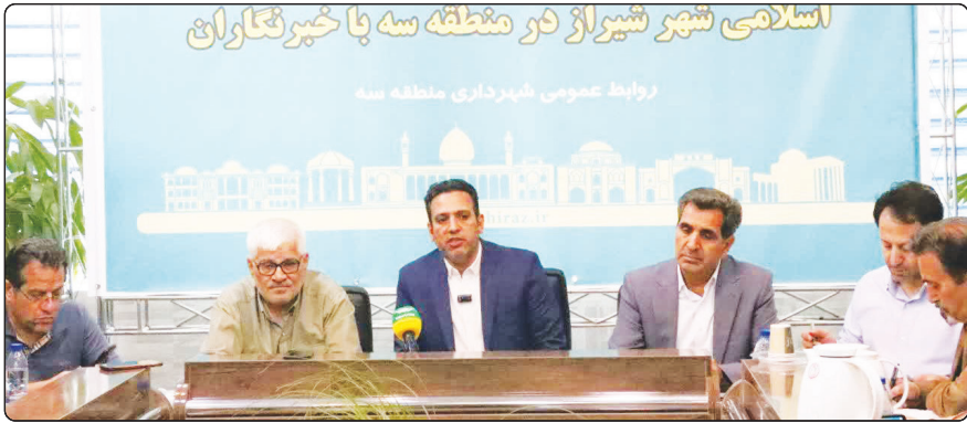
اسلامی شهر شیراز در منطقه سه با خبرنگاران روابط عمومی شهرداری منطقه سه

نتیجه اینکه همه خواسته‌ها و مطالبات معلمان باید با هم دیده شود و یکجا بر آورده شود تا «دریافت پیام» کامل باشد.