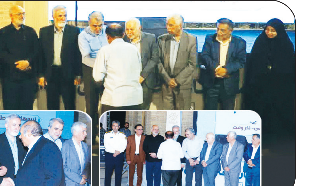
در آیین تجلیل از همیاران مهربان، نیروهای داوطلب مردمی مطرح شد:

تحلیل این خبر را در ستون «تحلیل خبر» بخوانید