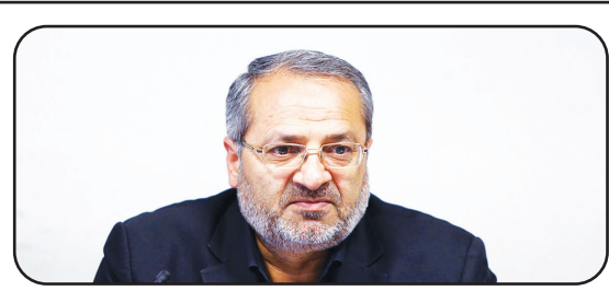
وزیر پیشنهادی آموزش و پرورش: