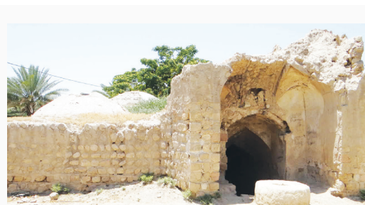
شهر شیراز واقع شده است.

ورودی حمام از سمت غرب است و سر در آن طاق دار و با دو پله به راهرو منتهی می‌شود. این راهرو در ابتدای مسیر به شکل قوس‌دار و در قسمت بعدی به صورت تیزه دار است. فضای سربینه (رختکن) دارای یک فضای مرکزی و چهار شامشین در اطراف است. در قسمت جنوبی سربینه یک ستون همراه با فضاهای پیرامونی تعبیه شده است که در پایه این ستون کفش کن قرار دارد. تمامی اضلاع این فضا توسط طاق‌نما تزئین شده است. فضای سربینه از طریق یک راهرو و فضاهای جانبی آن به قسمت اصلی حمام که گرمخانه نامیده می‌شود مرتبط می‌شود. بنا با مصالح لاشه‌سنگ و ساروج ساخته شده است و در بعضی از قسمت‌ها از ملات آهک نیز استفاده شده است. استحکام بنا در وضعیت خوبی است و هیچ‌گونه دخل و تصرف خاصی در آن صورت نگرفته است. دیوارهای بیرونی و سقف آن نیز با گاه‌گل اندود شده است. شهرستان قیرو کارزین سابقه نسبتاً کهن دارد در ۱۸۵ کیلومتری