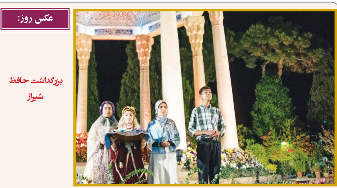
عکس روز: بزرگداشت حافظ شیراز

کلیسای تاریخی سان فرانسیسکو در کشور شیلی پس از بروز یک آتش‌سوزی بزرگ به طور کامل فرو ریخت. به گزارش ایلتا، کلیسای سان فرانسیسکو واقع در مرکز شهر سانتیاگو، نخستین کلیسای کاتولیکی است که در شیلی ساخته شده است. این کلیسا توسط «پدرو د والدیوا» در سال ۱۵۵۴ میلادی به عنوان یک کلیسا تأسیس شد که مجسمه‌ای پلی کروم از مریم مقدس را در خود جای داده بود. پس از زلزله‌ای در سال ۱۵۸۳ که کلیسا را تخریب کرد، راهبان کلیسای جدیدی را به جای آن ساختند. طرح اصلی کلیسا یک صلیب لاتین بود و برج ناقوس آن در سال ۱۸۵۷ بازسازی شد و در سال ۱۸۸۱ محراب‌های باروک با محراب‌های نئوکلاسیک