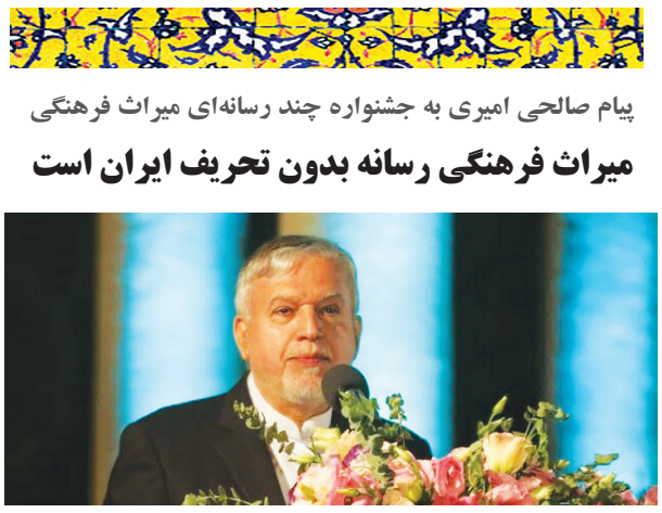
پیام صالحی امیری به جشنواره چند رسانه‌ای میراث فرهنگی