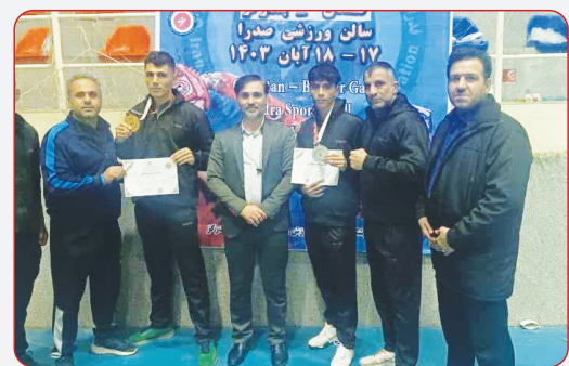
خوزستان از نزدیک نظاره گر رقابت ورزشکاران اعزامی بود.

سرپرست معاونت توسعه ورزش اداره کل ورزش و جوانان فارس در دیدار با روسا و اعضای هیئت‌های شمشیربازی و ژیمناستیک گفت: برگزاری رویدادهای ملی رشته‌های مختلف می‌تواند باعث توسعه این رشته‌ها شود و استان فارس آماده میزبانی رویدادها و رقابت‌های ملی است.