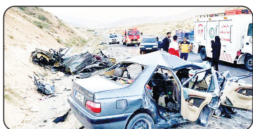
معاون وزیر بهداشت خبر داد:

آغاز متناسب‌سازی و صدور فیش حقوق بازنشستگان تامین اجتماعی