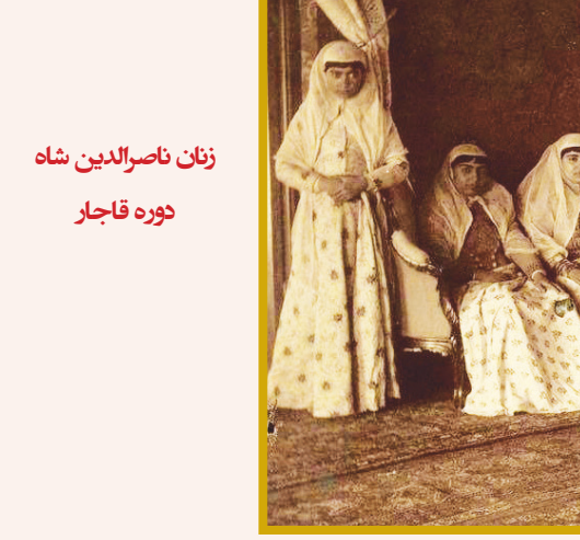
زنان ناصرالدین شاه دوره قاجار