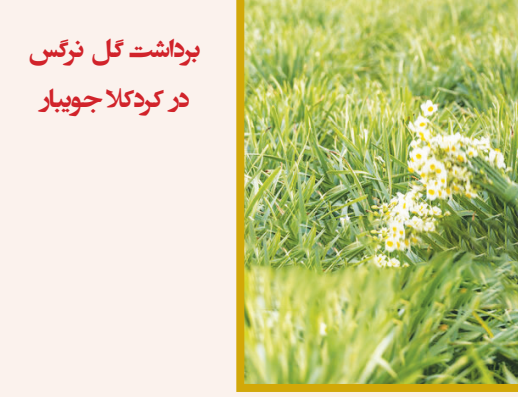
برداشت گل نرگس در کردکلا جویبار