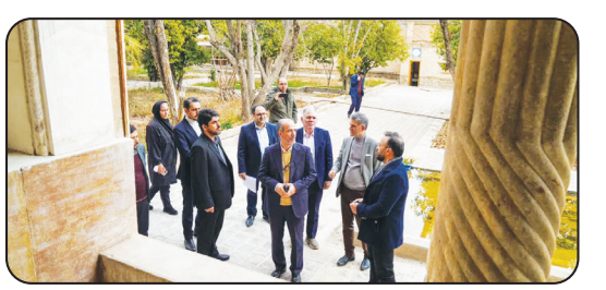
معاون وزیر راه و شهرسازی در شیراز مطرح کرد: