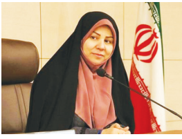
سخنگوی شورای اسلامی شهر شیراز

سخنگوی شورای اسلامی شهر شیراز خطاب به رئیس شورا و اعضای شورای شهر شیراز گفت: نگذارید فضای شورا مجدداً به بحث‌های بی‌نتیجه و حواشی آلوده شود، اگر اصرار برخی به تفرقه‌افکنی و شکستن وحدت و همدلی ادامه یابد، جای آن دارد که با استفاده از ابزارهای قانونی و رأی جمعی، به چنین رفتارهایی پایان دهیم.