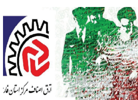
نمایندگان اصناف فارس

با این ایام در مجتمع‌های تجاری بزرگ، همچنین گلباران قبور شهدا و برگزاری جشن‌های مردمی از جمله برنامه‌های این کمیته برای اتحادیه‌های صنفی شهرستان شیراز، برگزاری ایستگاه‌های صلواتی در مجتمع‌های تجاری و فروشگاه‌های بزرگ، مشارکت اصناف استان در جشن‌های مردمی ایام الله دهه مبارک فجر، ایجاد شور و نشاط اجتماعی متناسب با دهه مبارک فجر با رعایت شئون اسلامی، برگزاری مسابقات فرهنگی ویژه واحدهای صنفی در مجتمع‌های تجاری، تجلیل از بانوان برتر و فعال همراه با ویژه برنامه‌های مرتبط با عفاف و حجاب و اهدای جوایز، دیدار با خانواده‌های شهدای اصناف با اولویت شهدای انقلاب، شرکت در ویژه برنامه‌ها و سالروز ورود حضرت امام (ره) به میهن اسلامی و غبارروبی مزار شهدا، حضور گسترده اصناف در راهپیمایی باشکوه ۲۲ بهمن و... همچنین اصناف فارس نیز در این جلسه بر لزوم امیدآفرینی و جهاد تبیین در ستاوردهای انقلاب اسلامی در دهه مبارک فجر تأکید کرد.