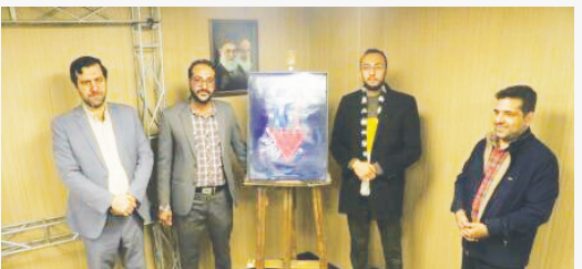
مدیرکل فرهنگ و ارشاد اسلامی استان فارس

مدیرکل فرهنگ و ارشاد اسلامی استان فارس از برپایی هجدهمین جشنواره بین‌المللی فیلم مقاومت خبر داد و گفت: این جشنواره نشان می‌دهد که مفهوم مقاومت مرزهای کشور را درنوردیده و حتی در کشور آمریکا هم این موضوع خود را نشان داده است.