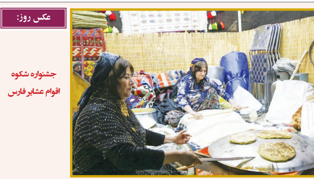
عکس روز: جشنواره شکوه اقوام عشایر فارس

خواهد کرد. کتابی که می‌خوانید تنها چند صفحه نیست بلکه حاصل تجربیات صمیمانه و چهارساله نویسنده و شاگردانش بوده است. همچنین در نوشته پشت جلد کتاب می‌خوانیم: «روایت‌هایی از سبک زندگی نوجوانان امروزی» در هر فصل یکی از چالش‌هایی را که نوجوانان و دانش‌آموزان دنیای جدید با آن مواجه‌اند برای مخاطبان به رشته تحریر در آورده است؛ چالش‌هایی همچون دین‌گریزی، اعتیادهای اینترنتی، تک‌فرزند، مصرف مواد مخدر، انتخاب رشته اشتباه، پرخاشگری، دل‌بستگی‌های ناسالم، خودکشی، نداشتن الگو و... که حل این تضادهای از طریق ارتقای اطلاعات و معلومات نوجوانان، والدین و مربیان امکان‌پذیر است.