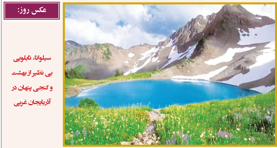
عکس روز: سیلوانا، تابلویی بی نظیر از بهشت و گنجی پنهان در آذربایجان غربی

افزایش یادشده معادل ۲۰ درصد در پلتفرم فیلمو و ۲۶٫۶ درصد در پلتفرم فیلم‌نت است. فیلم‌نت البته برای عید نوروز، طرح موقت تخفیف ارائه کرده که گاه تا ۶۰ درصد تخفیف به مشتریان می‌دهد. روند گرانی‌های سرویس‌های وی‌اودی در سال‌های گذشته نشان می‌دهد احتمالاً هزینه اشتراک سرویس‌های رقیب نیز به زودی بالا خواهد رفت. نکته مهم آن که ارقام یادشده بعد از افزودن ۱۰ درصد به عنوان مالیات بر ارزش افزوده به حدود ۲۲۰ هزار تومان (در فیلمو) و حدود ۲۱۰ هزار تومان (در فیلم‌نت) می‌رسد و از آنجا که هم‌اکنون