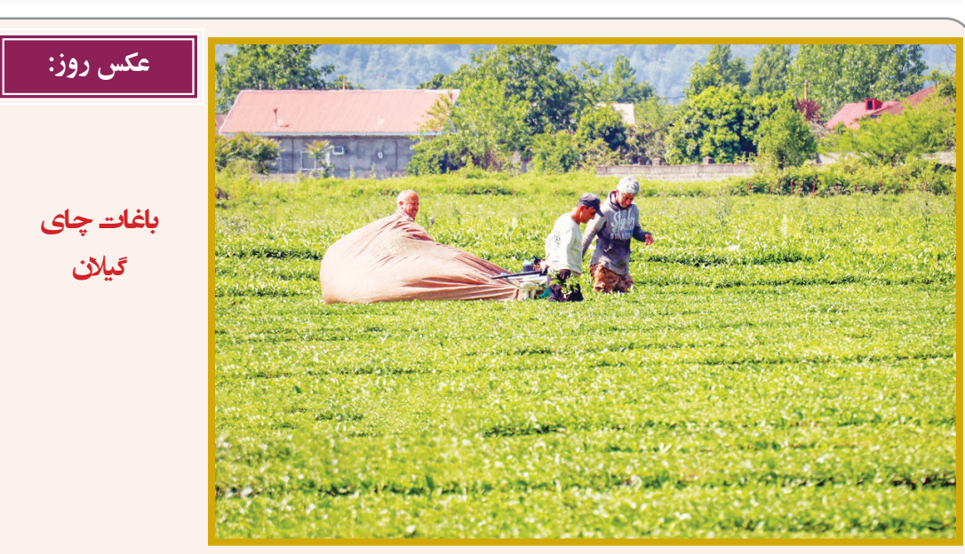
عکس روز: باغات چای میان