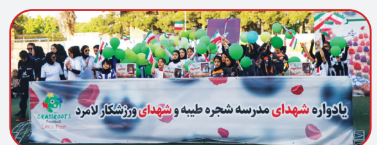
یادواره شهدای مدرسه شجره طیبه و شهدای ورزشکار لامرد

همزمان با گرامیداشت روز جهانی فوتبال پایه، فستیوال فوتبال رده سنی ۱۲ سال در استادیوم شهید دستغیب شیراز با حضور پرشور کودکان و نوجوانان فوتبالیست، پیشگوسان فوتبال، مسئولان ورزشی و خانواده‌ها برگزار شد. به گزارش دریافتی روزنامه طلوع از روابط عمومی اداره کل ورزش و جوانان فارس، این رویداد فرهنگی - ورزشی که به یاد شهدای دانش‌آموز مدرسه شجره طیبه مناب و شهدای ورزشکار شهرستان لامرد برگزار شد، صحنه‌ای از شور، نشاط، استعداد و انگیزه نسل آینده فوتبال ایران را به نمایش گذاشت. در این جشن بزرگ فوتبالی، پیشگوسان و مسئولان حاضر ضمن حمایت از فوتبال پایه، از نزدیک شاهد توانمندی‌ها و استعدادهای نسل آینده فوتبال استان بودند. حضور آنان در کنار خانواده‌ها و ورزشکاران، جلوه‌ای ویژه به این رویداد بخشید. فوتبالیست‌های آینده‌ساز فارس در فضایی سرشار از هیجان، رقابت سالم و دوستی، مهارت‌های خود را به نمایش گذاشتند و با اجرای برنامه‌های متنوع، لحظات خاطره‌انگیزی را رقم زدند.