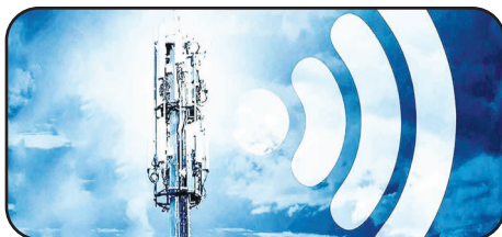
کارشناس فنی حوزه فاوا:

نظیر این خبر را در ستون «تحلیل خبر» بخوانید