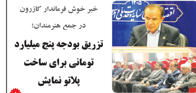
خبر خوش فرماندار کازرون در جمع هنرمندان؛