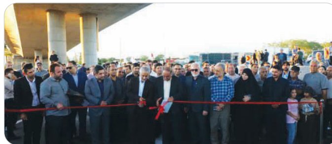
در هشتاد و سومین جهش عمرانی کلان شهر شیراز؛