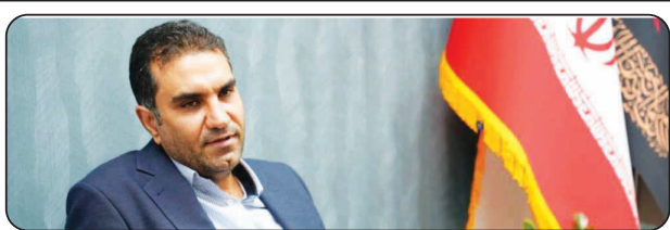
پوردهقان عضو کمیسیون صنایع و معادن مجلس: