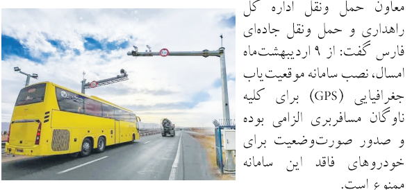
معاون حمل و نقل اداره کل